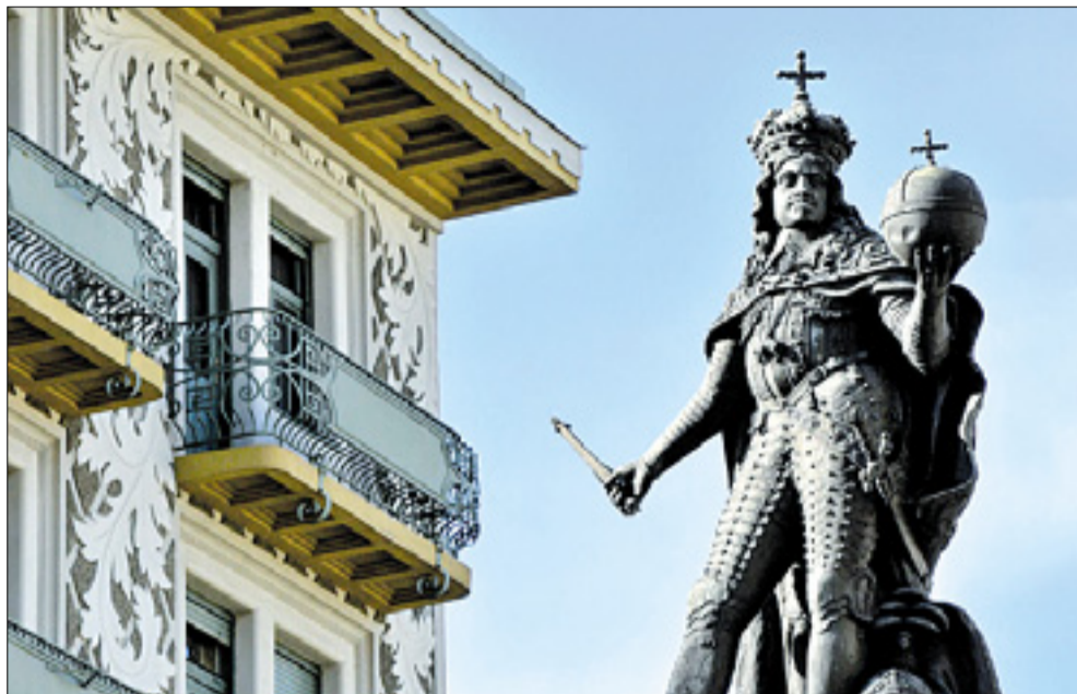
Levo fasada Fabianijeve palače na Borznem trgu, desno »Casa delle Cariatidi« pri Orehu, spodaj detajl vodnjaka »Giovannin« na Ponterošu

Fotograf Donato Riccesi je v njej zbral nad 200 neobičajnih tržaških utrinkov - Jutri predstavitev v Palači Gopčević